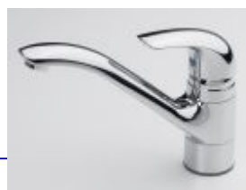
1720 Svärd Kirsi