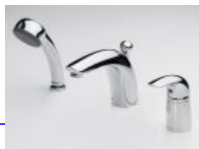
1750 Svärd Kirsi