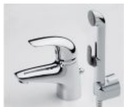
1708f Svärd Kirsi