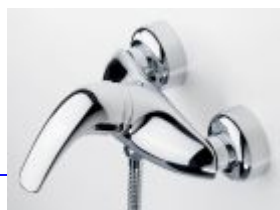
1760u Oras Svärd Kirsi