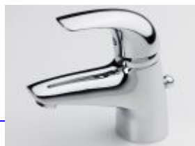
1704 Svärd Kirsi