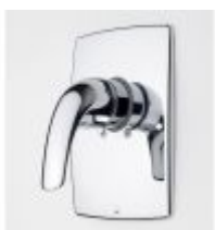
1787 Svärd Kirsi