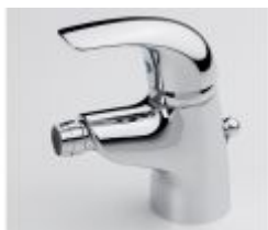
1718 Svärd Kirsi