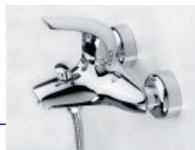
1740u Svärd Kirsi