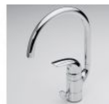
1739 Svärd Kirsi