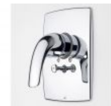
1788 Svärd Kirsi