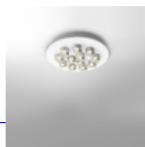
DUE 200 De Bevilacqua Carlotta