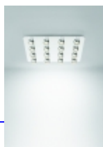
DUE 300 QUADRA De Bevilacqua Carlotta