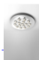
DUE 300 De Bevilacqua Carlotta