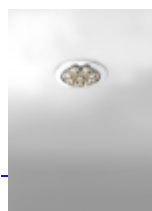
DUE 160 De Bevilacqua Carlotta