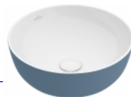
Artis tondo Villeroy & Boch