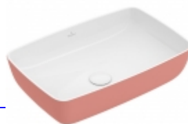
Artis rettangolare Villeroy & Boch