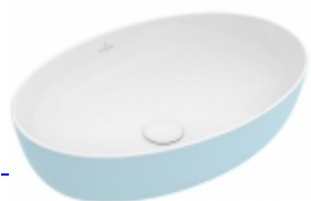
Artis ovale Villeroy & Boch Villeroy & Boch