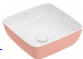
Artis quadrato Villeroy & Boch