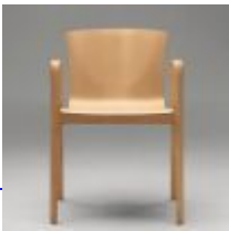
Cirene 3 De Padova Magistretti Vico