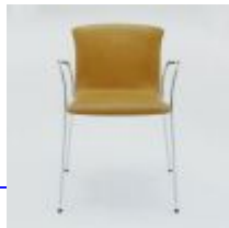
Cirene 2 Magistretti Vico