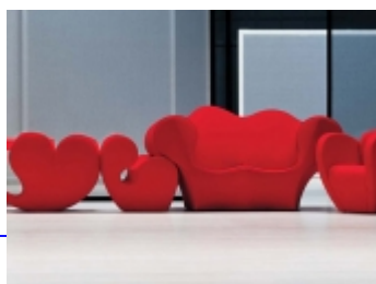
Soft Little Easy SP050