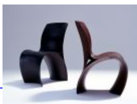
Three Skin Chair