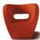
Victoria and Albert VA042