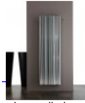
Qualcosa di elegante