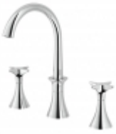
130 Lavabo Rubinetterie Stella S.p.A. De Lucchi Michele