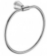
130 Accesorios Rubinetterie Stella S.p.A. De Lucchi Michele