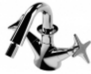
130 Bidet Rubinetterie Stella S.p.A. De Lucchi Michele