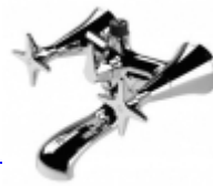
130 Bañeras/Duchas Rubinetterie Stella S.p.A. De Lucchi Michele