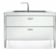
2C/130 Alpes inox