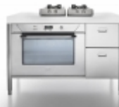
130 Ovens Alpes inox