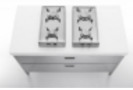
T/130 cooking Alpes inox